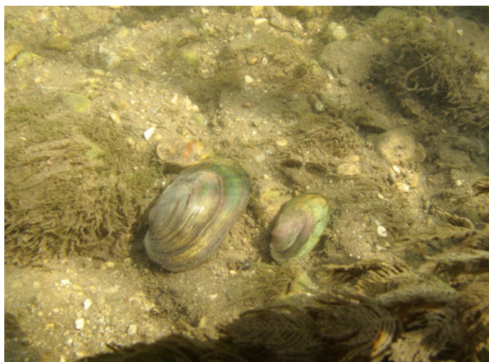
Abb. 3: Eine etwa 5-jährige (links) und eine etwa 3-jährige (rechts) Unio crassus cytherea aus der Warmen Fischa bei Bad Fischau.