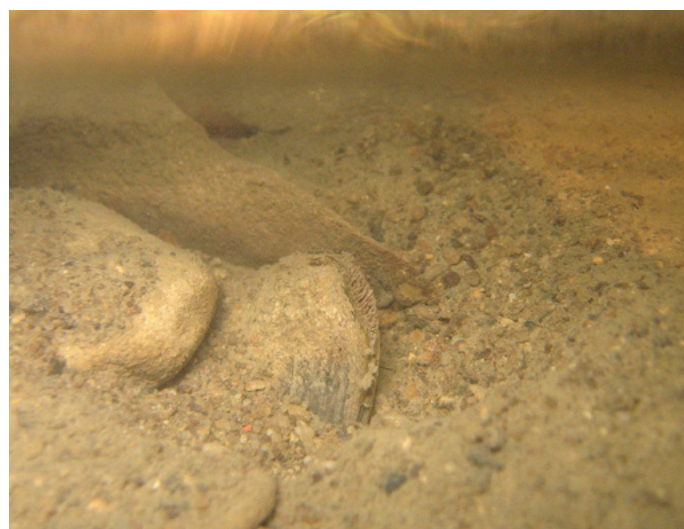
Abb. 1: Das letzte lebend beobachtete Individuum von Unio crassus cytherea im Elsbach. Foto: 4. Oktober 2011.

Durch die Errichtung eines Sportplatzes mit Entwässerungen in den Elsbach im Jahr 2009 und durch mehrfache Erdarbeiten im Bachbett bachaufwärts kam es zur Mobilisierung von Substrat und massiven Schlammablagerungen. Trotz Einschreitens der Naturschutzbehörde und teilweisen Änderungen bei der zuvor in den Elsbach mündenden Entwässerung des Sportplatzes waren bei der letzten Begehung im Juni 2017 nur mehr sehr vereinzelt ältere Leer-