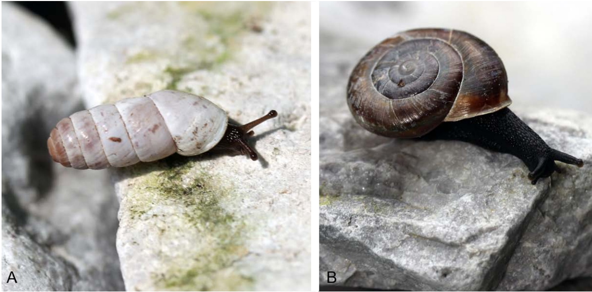
Abb. 2. Ausgewählte Arten im Habitat. A. Cylindrus obtusus (Draparnaud, 1805) – Zylinder-Felsenschncke, Leobner Mauer (Fundort 4). B. Chilostoma (Achatica) achates cingulina (Deshayes, 1839) – Achat-Felsenschncke, Johnsbach, Felssteig zur Ebneralm, Kalkfelswand (Fundort 7).