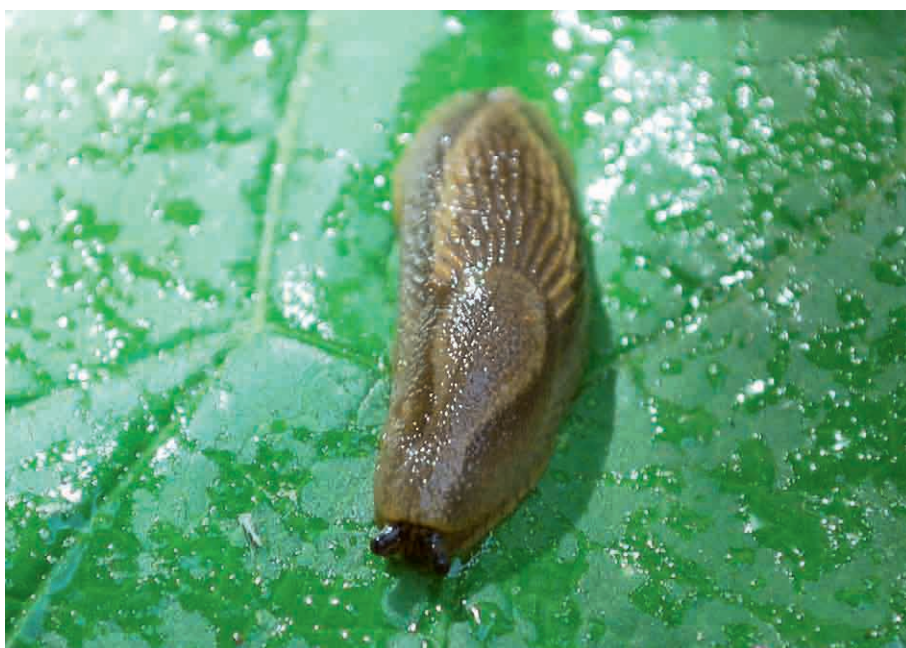
Abb. 1-2: (1) Arion vulgaris ; (2) Arion distinctus .