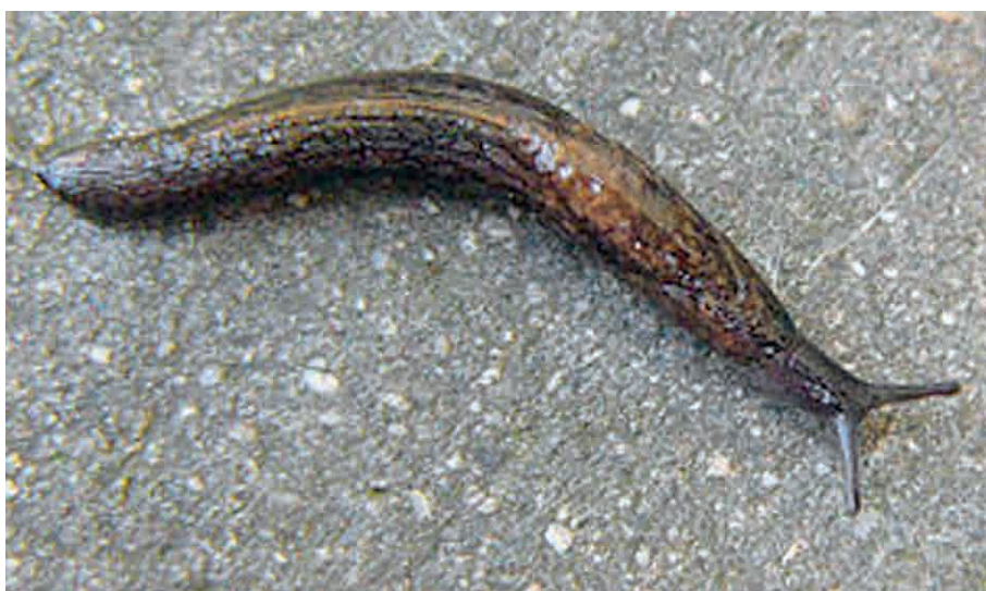
Abb. 3-4: (3) Deroceras reticulatum ; (4) Tandonia budapestensis .